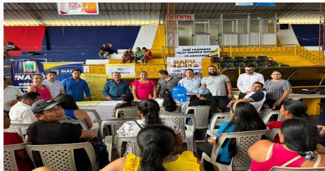
FOTOGRAFIA 2. PRODUCCION