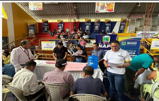
FOTOGRAFIFA 4: MESA 3 DE NACIONALIDADES Y TURISMO