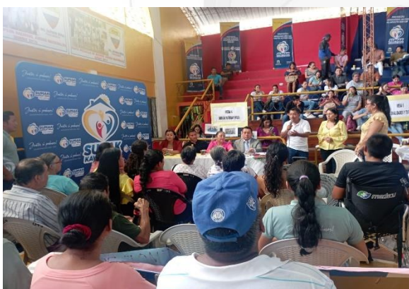
FOTOGRAFIA 4: SUMAK KAWSAY WASI