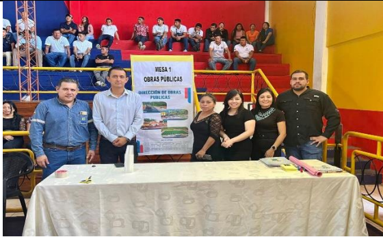
FOTOGRAFIA 1: MESA DE VIALIDAD