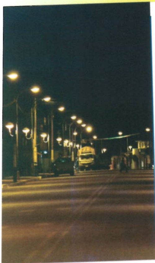
CANTÓN C.J. AROSEMENA TOLA

tiempo en que ostentan las calidades respectivas.