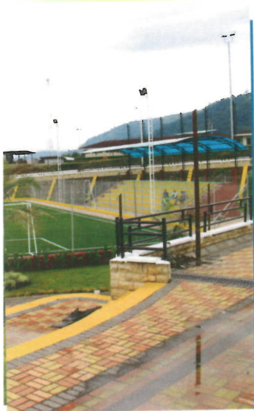
CANTÓN EL CHACO

Art. 14.- De las Comisiones Especiales y Técnicas.- La Función de Participación, a través de sus órganos directivos, puede crear comisiones de trabajo que se considere necesarias para el cumplimiento de sus funciones y atribuciones.