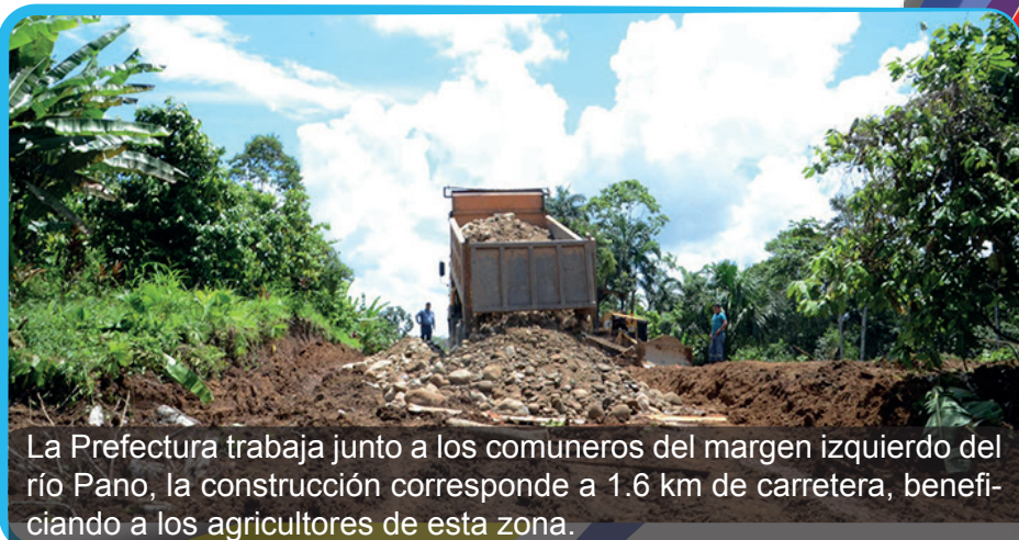
La Prefectura trabaja junto a los comuneros del margen izquierdo del río Pano, la construcción corresponde a 1.6 km de carretera, beneficiando a los agricultores de esta zona.