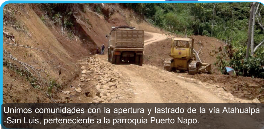
Unimos comunidades con la apertura y lastrado de la vía Atahualpa -San Luis, perteneciente a la parroquia Puerto Napo.