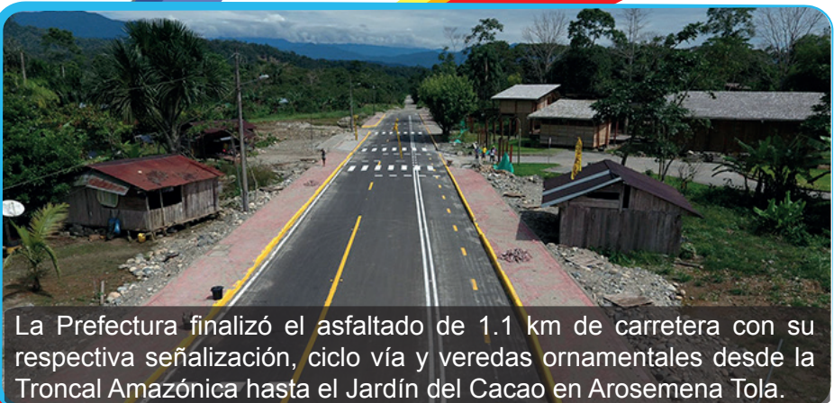
La Prefectura finalizó el asfaltado de 1.1 km de carretera con su respectiva señalización, ciclo vía y veredas ornamentales desde la Troncal Amazónica hasta el Jardín del Cacao en Arosemena Tola.