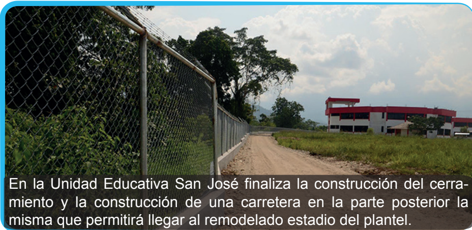
En la Unidad Educativa San José finaliza la construcción del cerramiento y la construcción de una carretera en la parte posterior la misma que permitirá llegar al remodelado estadio del plantel.