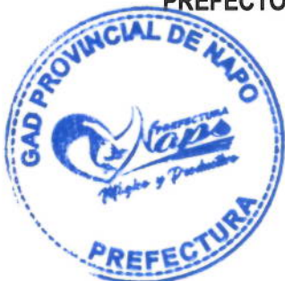
COORDINADORA DE PARTICIPACIÓN CIUDADANA