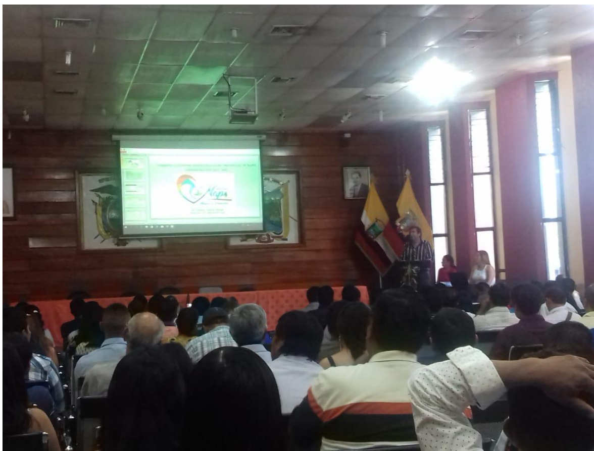
ASAMBLEA PROVINCIAL ANTEPROYECTO PRESUPUESTO AÑO FISCAL 2020