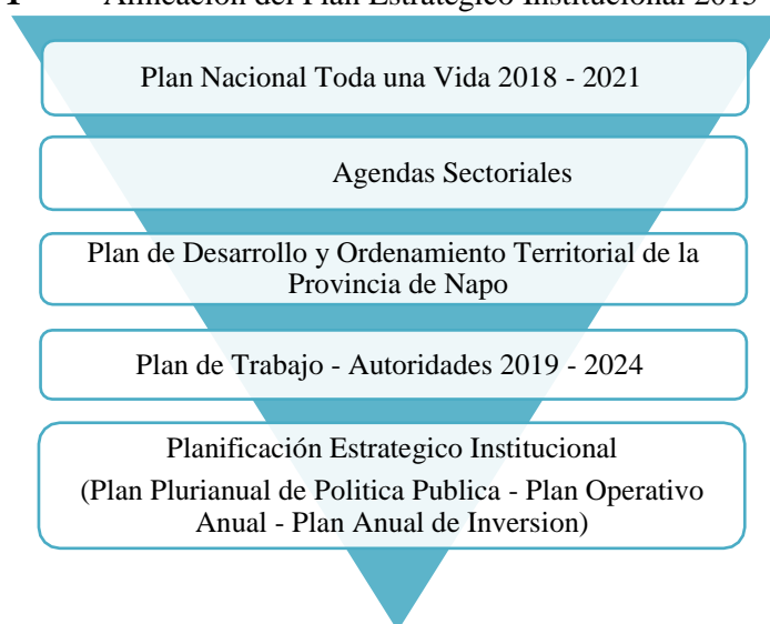
Gráfico 1 Alineación del Plan Estratégico Institucional 2015 - 2019

Elaboración: Unidad de Planificación Institucional, Gobierno Provincial de Napo