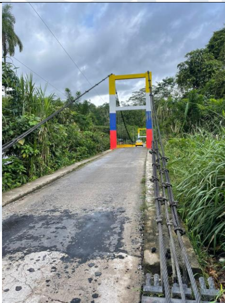
Fotografía No. 3 y 4.- Libre de desechos y habilitado al transito.