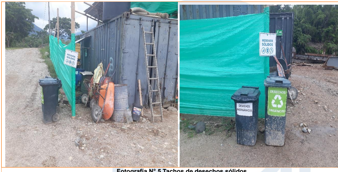
Fotografía N° 5 Tachos de desechos sólidos

4.2.5 Los tachos de desechos sólidos está ubicado en el área del trabajo, comunidad.