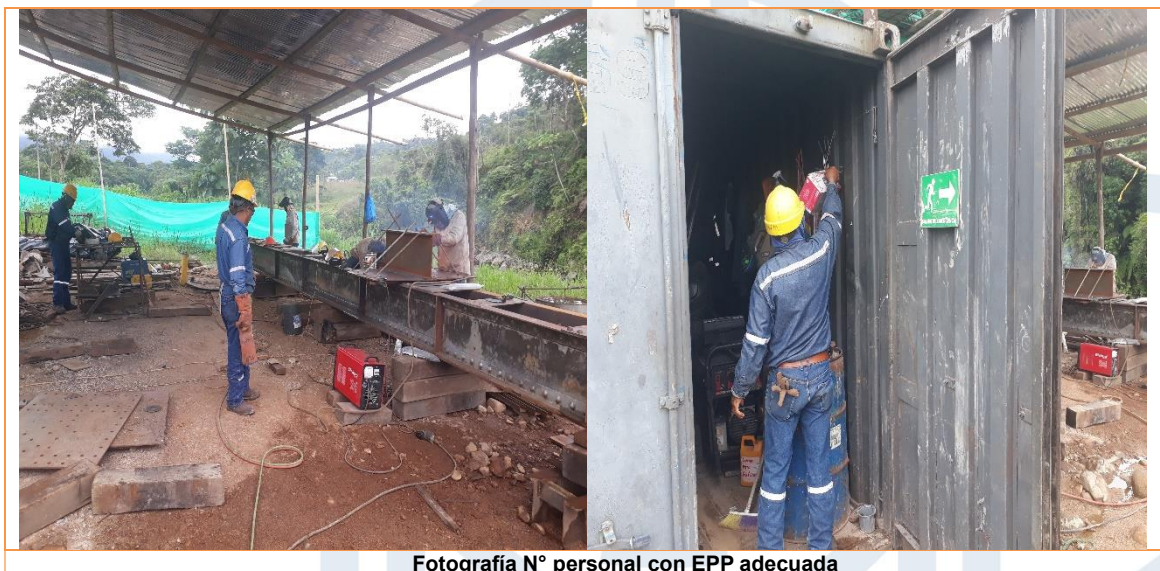
Fotografía N° personal con EPP adecuada

inferior mediante sandblasting, pintura de cordón inferior con fondo anticorrosivo, de lo cual se constata los siguientes hallazgos.