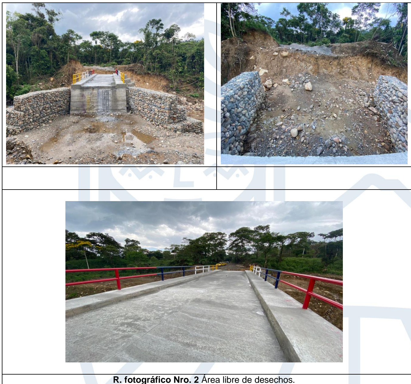
R. fotográfico Nro. 2 Área libre de desechos.