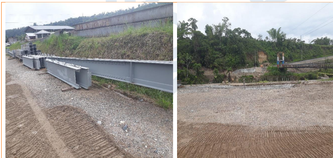
Fotografía N° 4 Áreas intervenidas

4.2.4 Las áreas intervenidas se encuentran libre de desechos de obra/obstáculos.