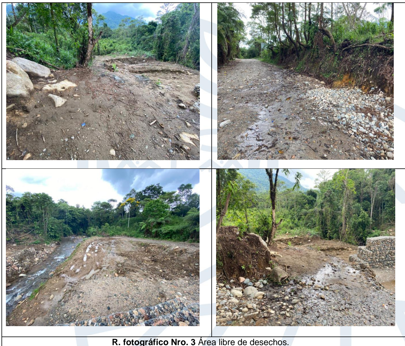
R. fotográfico Nro. 3 Área libre de desechos.