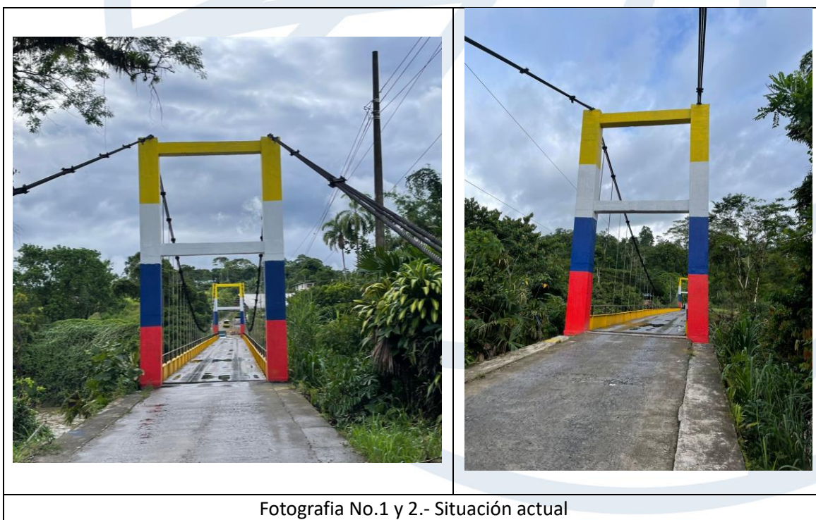
Fotografia No.1 y 2.- Situación actual

El área de intervención se encuentra libre de desechos y el puente habilitado para el tránsito vehicular.