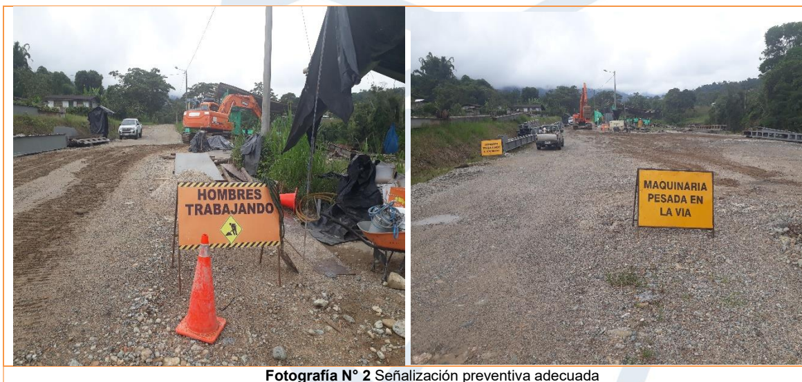
Fotografía N° 2 Señalización preventiva adecuada