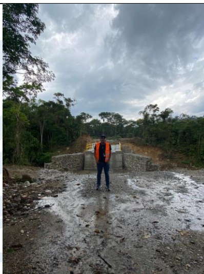
R. fotográfico Nro. 1 Ubicación del proyecto.