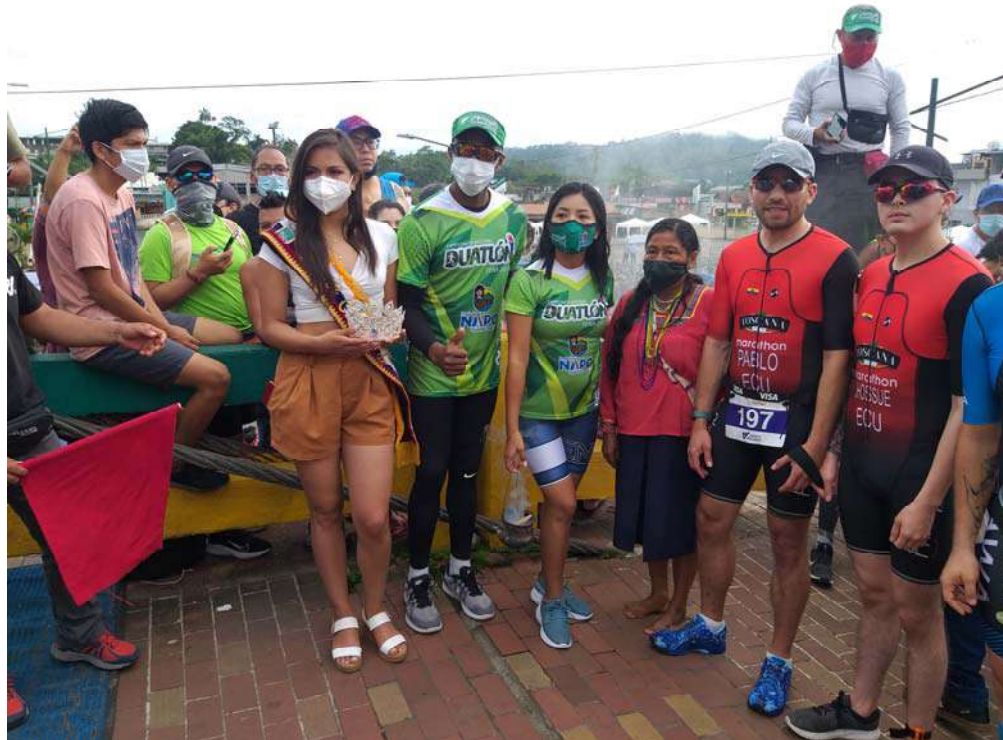
Evento competencia nacional Duatlón Tena 2021