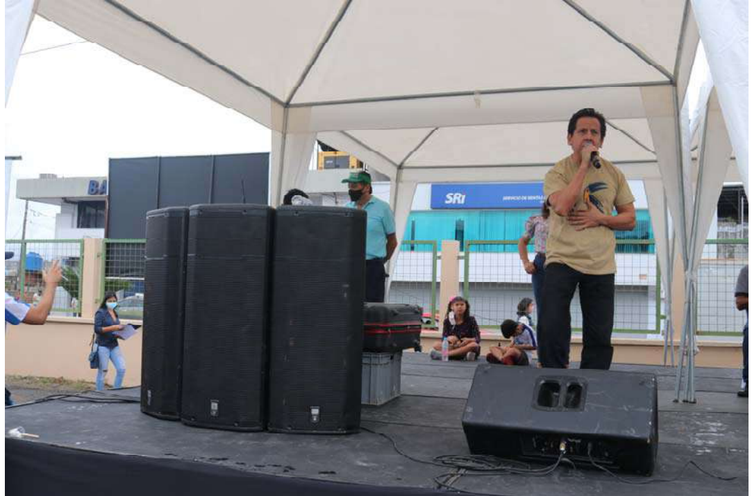
Promotor cultural 3, presentación de artista local.