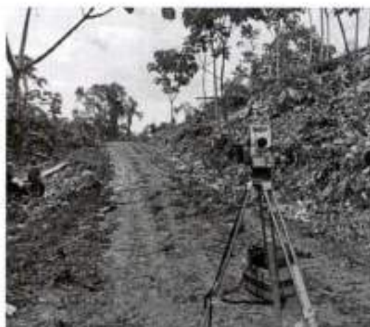
Levantamiento en campo