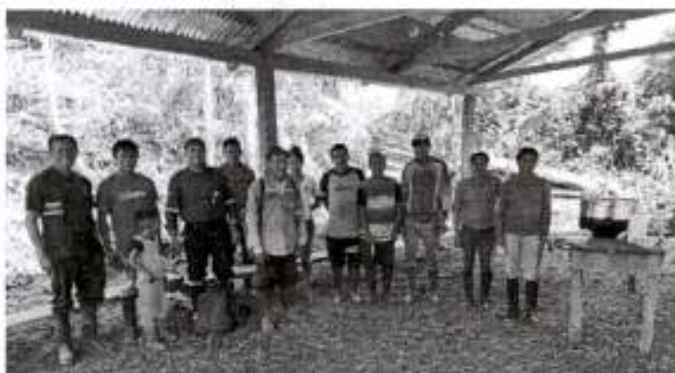
Parte de los mingueros que estuvieron ayudando.