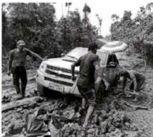
Camioneta sin poder salir debido a la lluvia