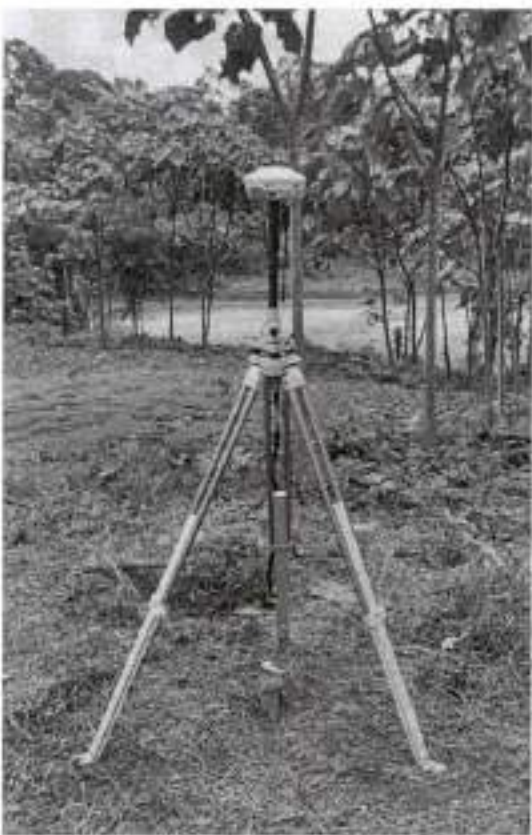
Colocación de Punto GNSS para georreferenciación.