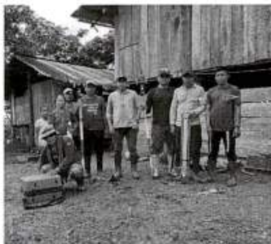
Inicio de jornada Selva Amazónica.