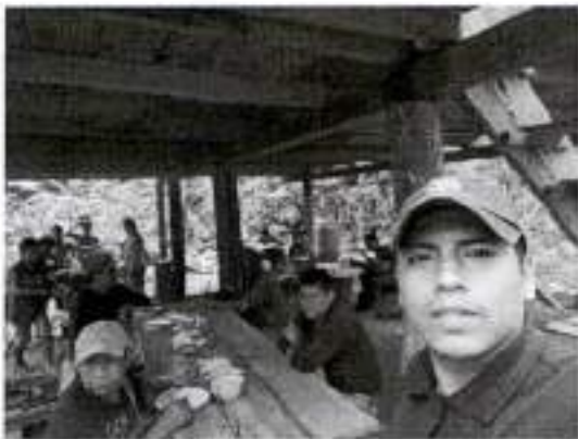
Personal compartiendo el almuerzo