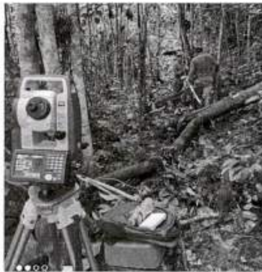
Levantamiento de campo.