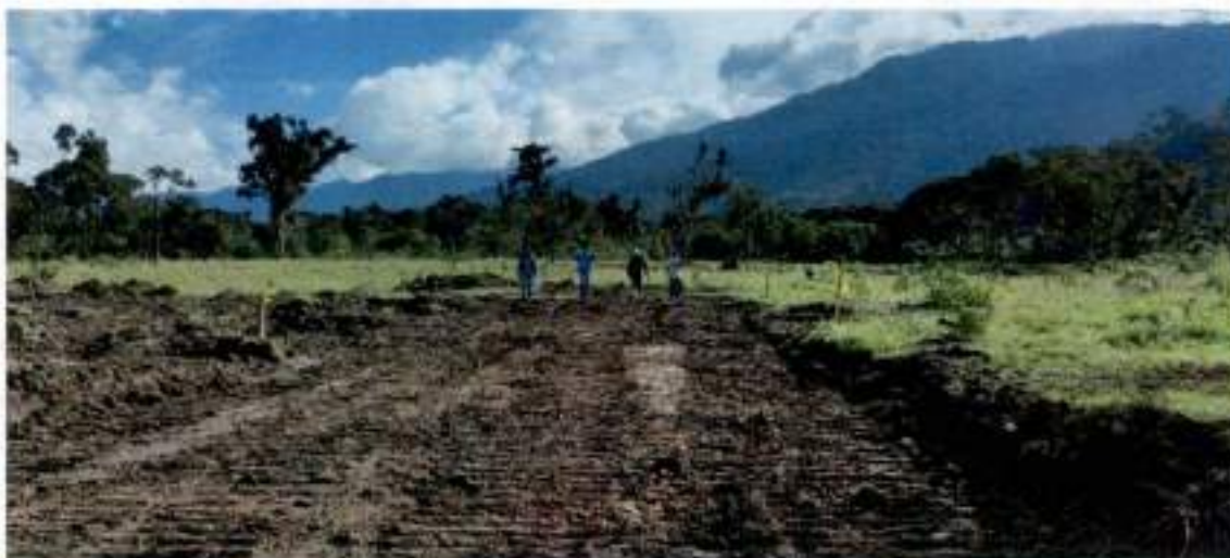
Laterales cada 10m identificando cantidades de cortes y/o rellenos