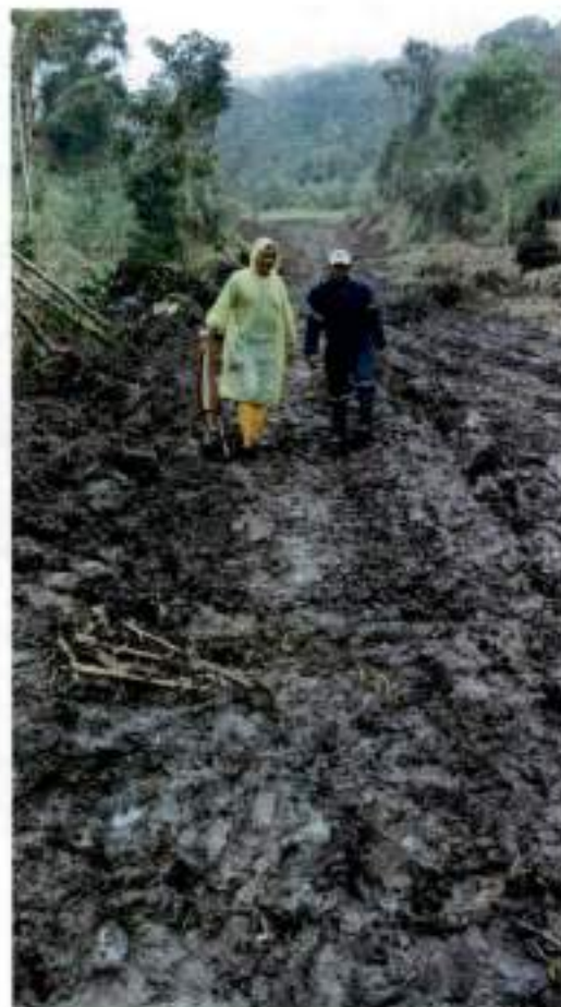
Grupo de trabajo en campo