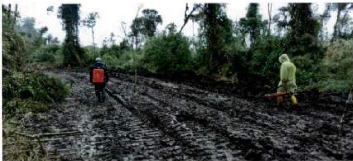
Inicio de jornada Cuyuja – Cedros 3.