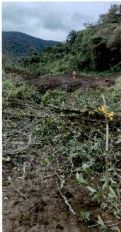
Balizas del replanteo del eje cada 10m