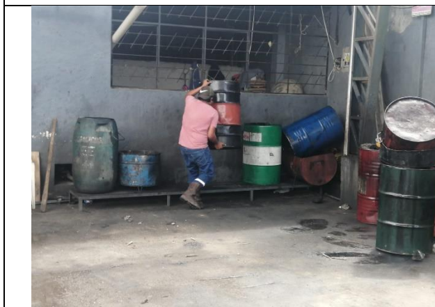
Fotografía 5: Entrega de desechos P&E