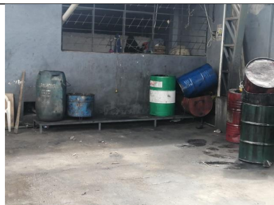
Fotografía 6: Entrega de desechos P&E