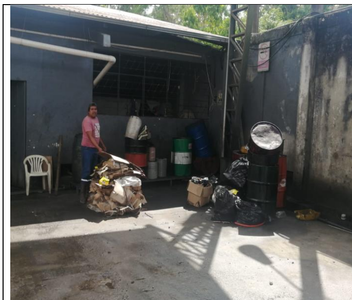
Fotografía 3: Entrega de desechos P&E

DIRECCION DE GESTIÓN AMBIENTAL UNIDAD DE CALIDAD AMBIENTAL Y MINERÍA