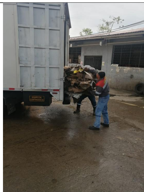
Fotografía 4: Entrega de desechos P&E